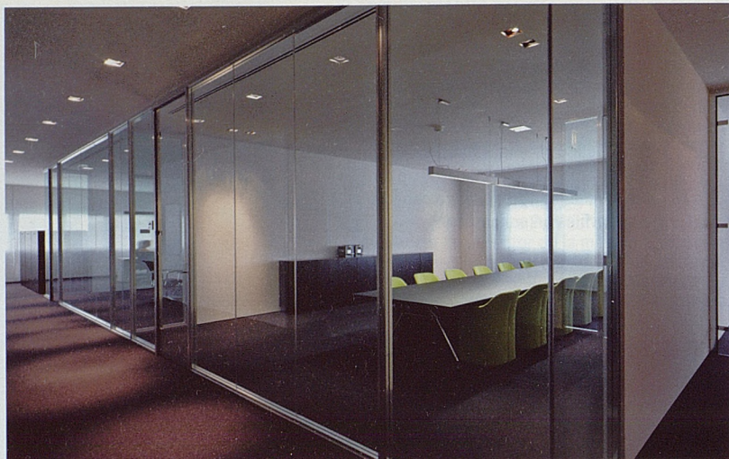
Genia SpA (Milán). El espacio está subdividido con extrema ligereza por la mampara WG en vidrio transparente y estructura abrigantada.