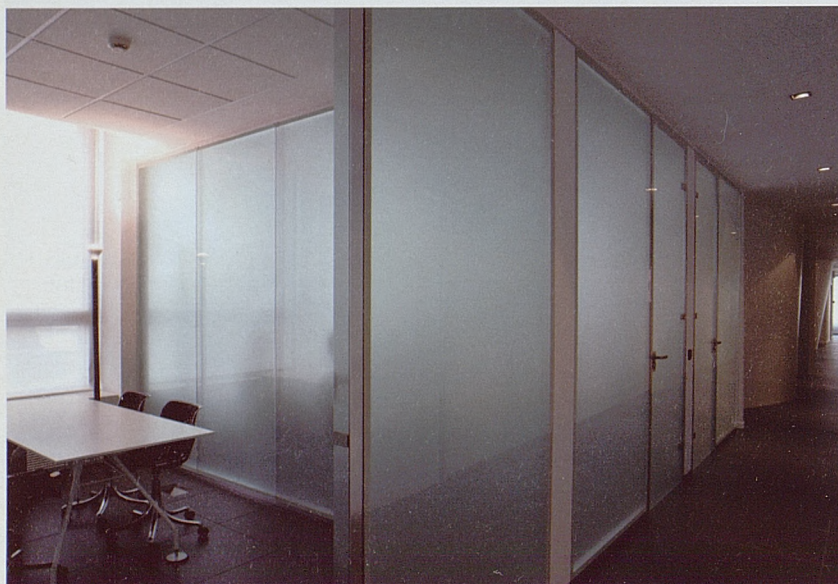
La Rinascente (Milán). Partition WG (Centro Progetti Tecno.05) en vidrio transparente arenado dividen el espacio y crean volúmenes destinados al trabajo en equipo. Los despachos reservados a la dirección y a los coordinadores están completamente cerrados por la mampara divisoria y el tabique armario en acabado lacado blanco opaco.