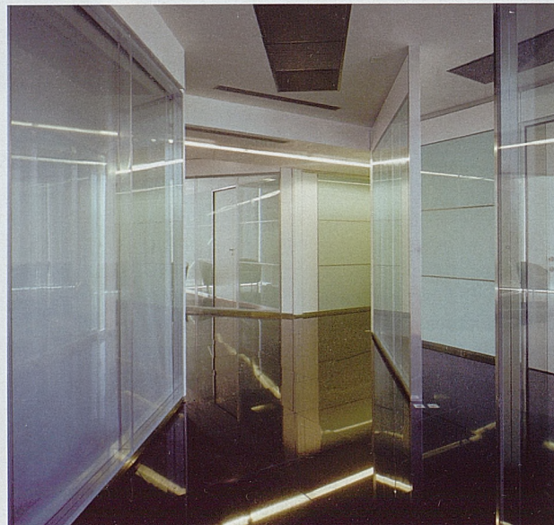
Nuova Fiera Milano. La utilización de WB y WG aporta a las plantas transparencia y luminosidad para exaltar la imagen sobria y elegante del proyecto.